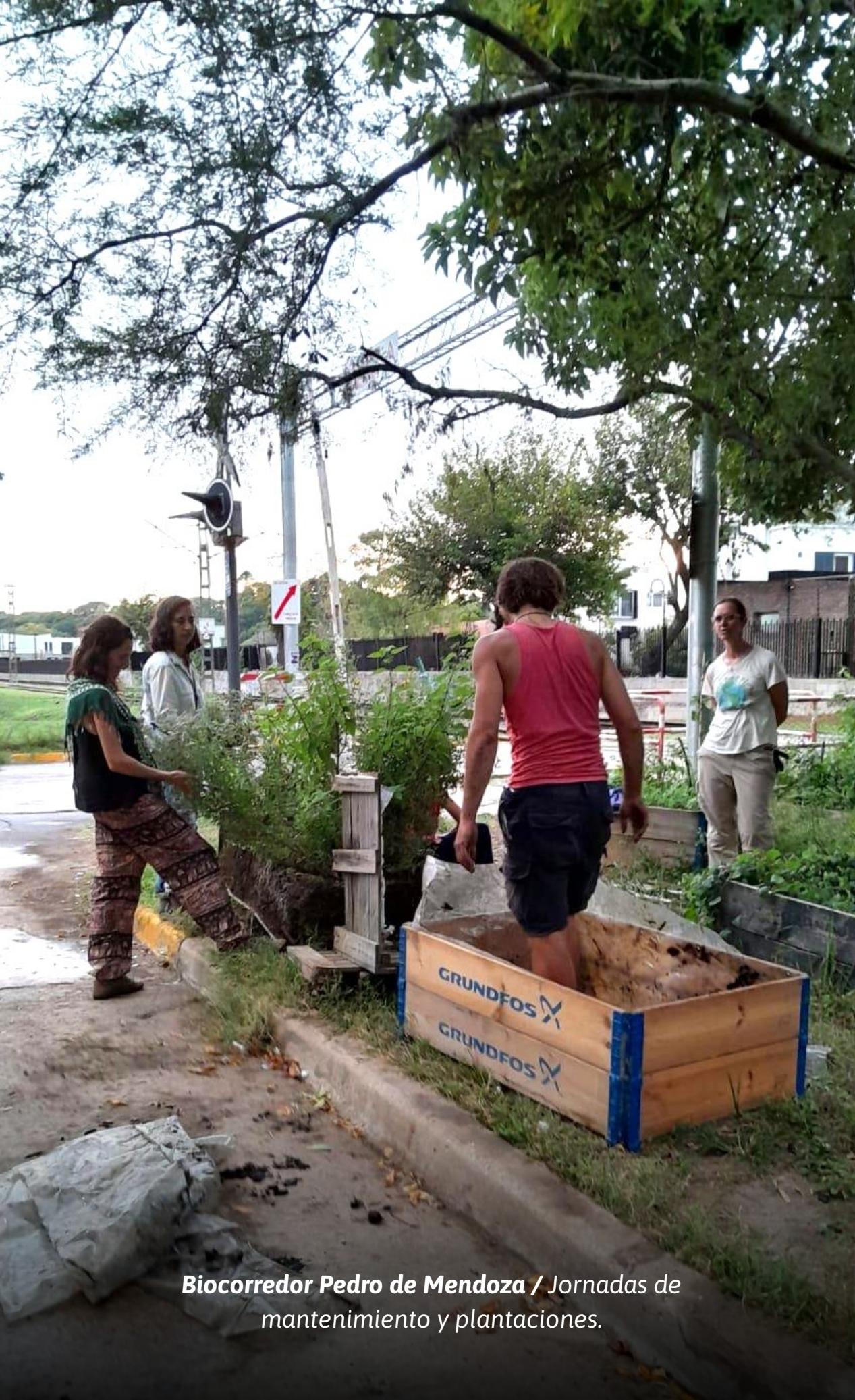
Biocorredor Pedro de Mendoza / Jornadas de mantenimiento y plantaciones.