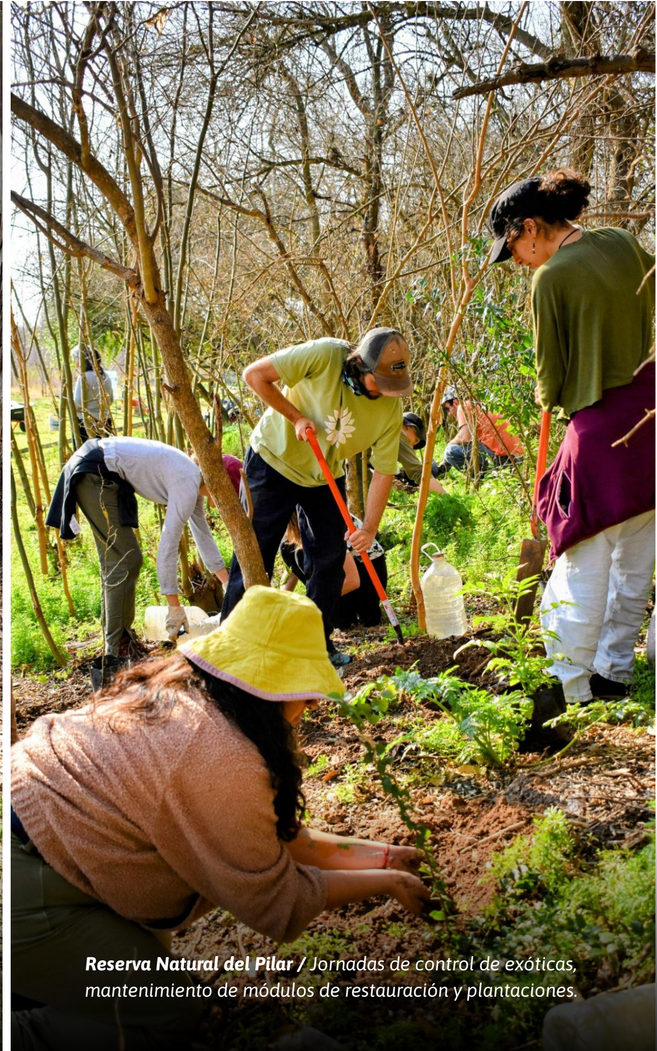
Reserva Natural del Pilar / Jornadas de control de exóticas, mantenimiento de módulos de restauración y plantaciones.