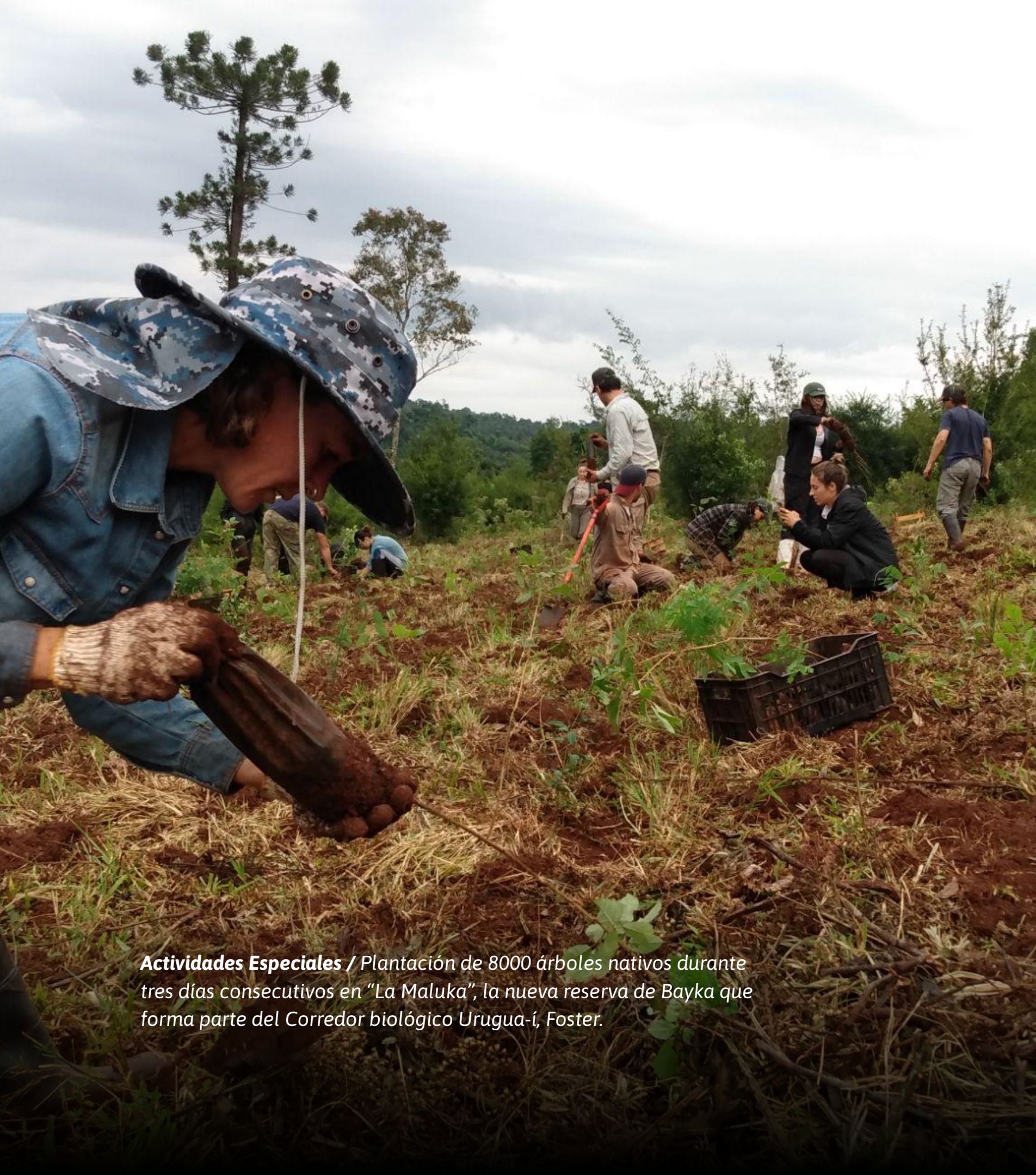
Actividades Especiales / Plantación de 8000 árboles nativos durante tres días consecutivos en "La Maluka", la nueva reserva de Bayka que forma parte del Corredor biológico Urugua-í, Foster.