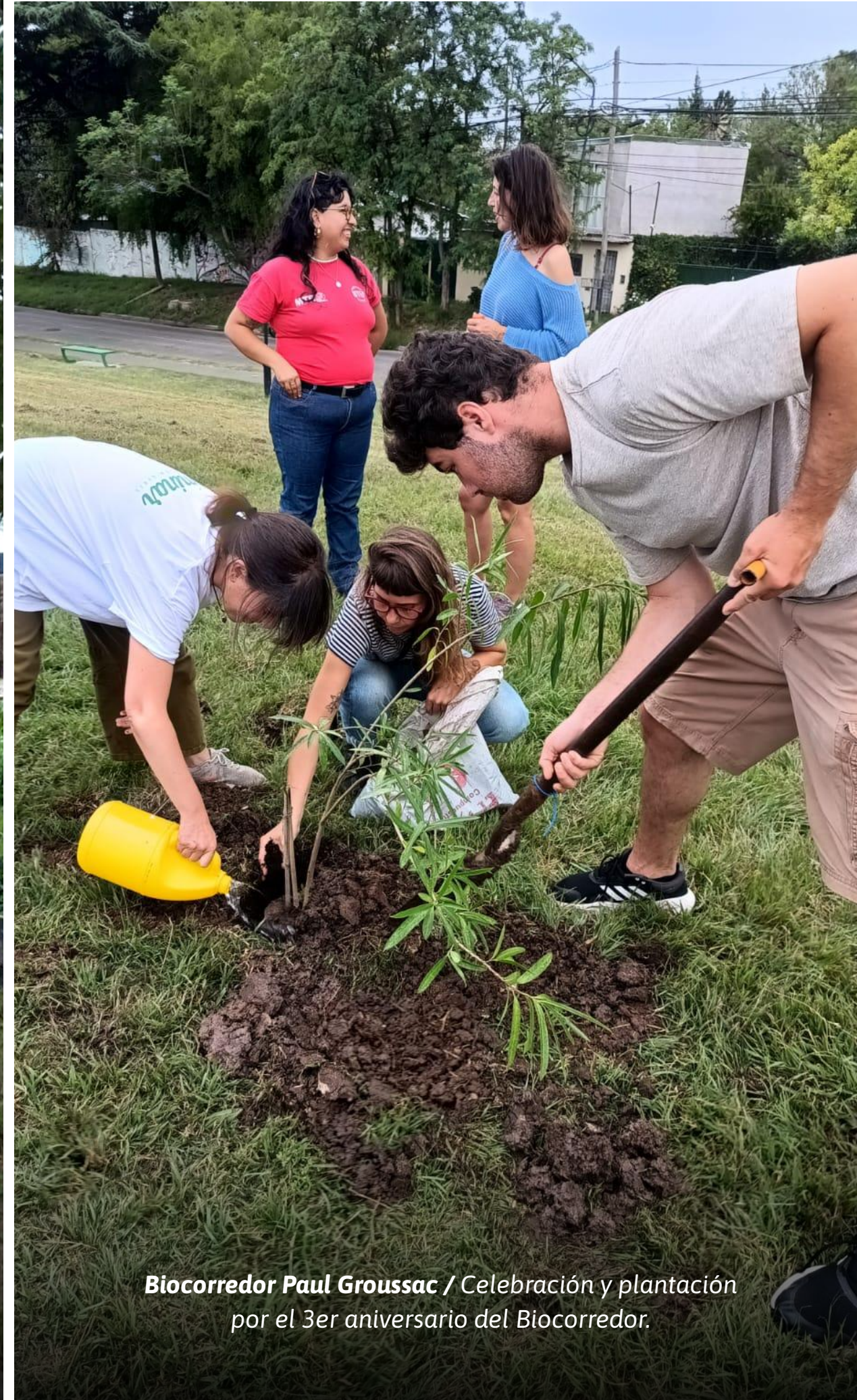
Biocorredor Paul Groussac / Celebración y plantación por el 3er aniversario del Biocorredor.