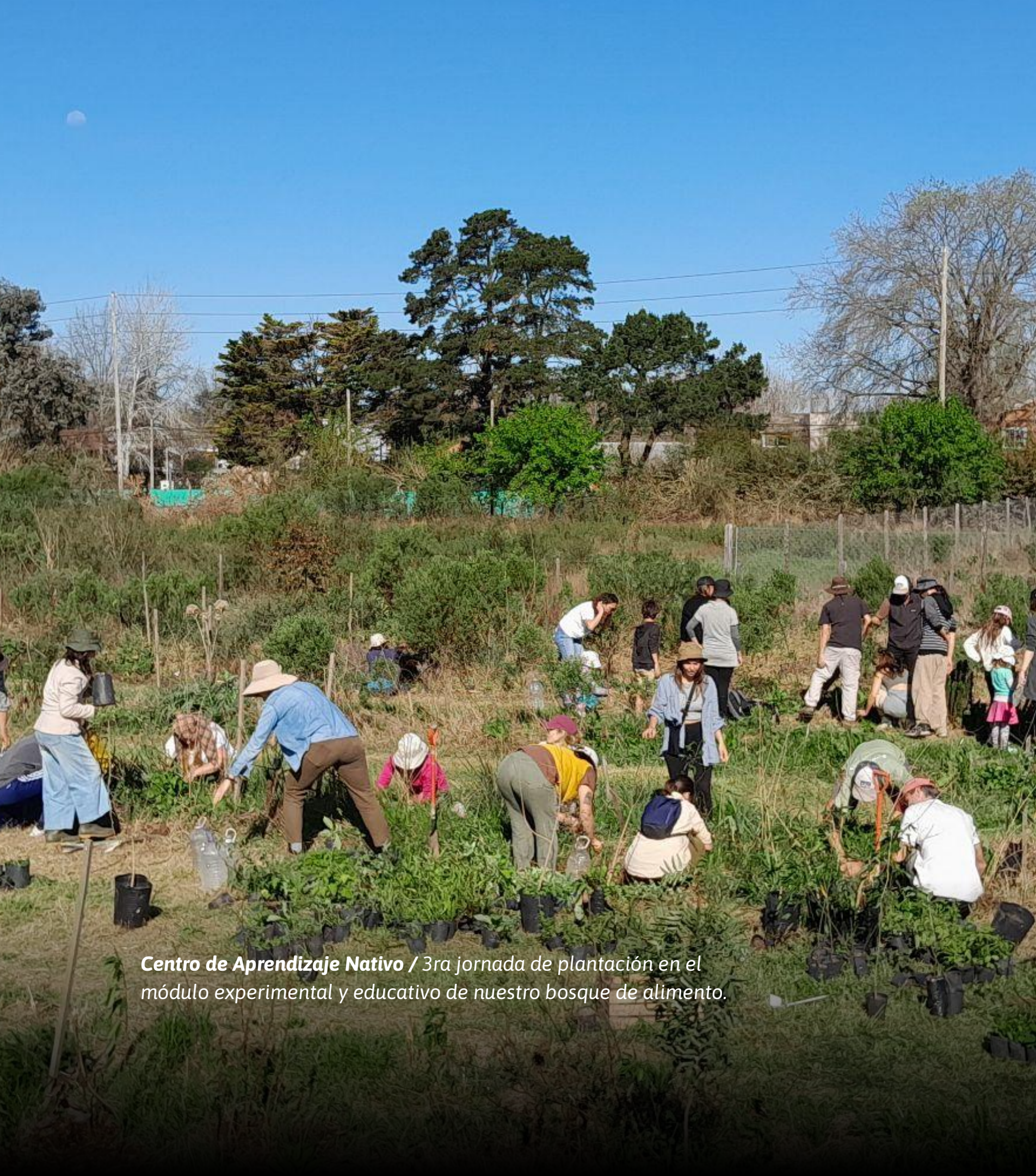
Centro de Aprendizaje Nativo / 3ra jornada de plantación en el módulo experimental y educativo de nuestro bosque de alimento.