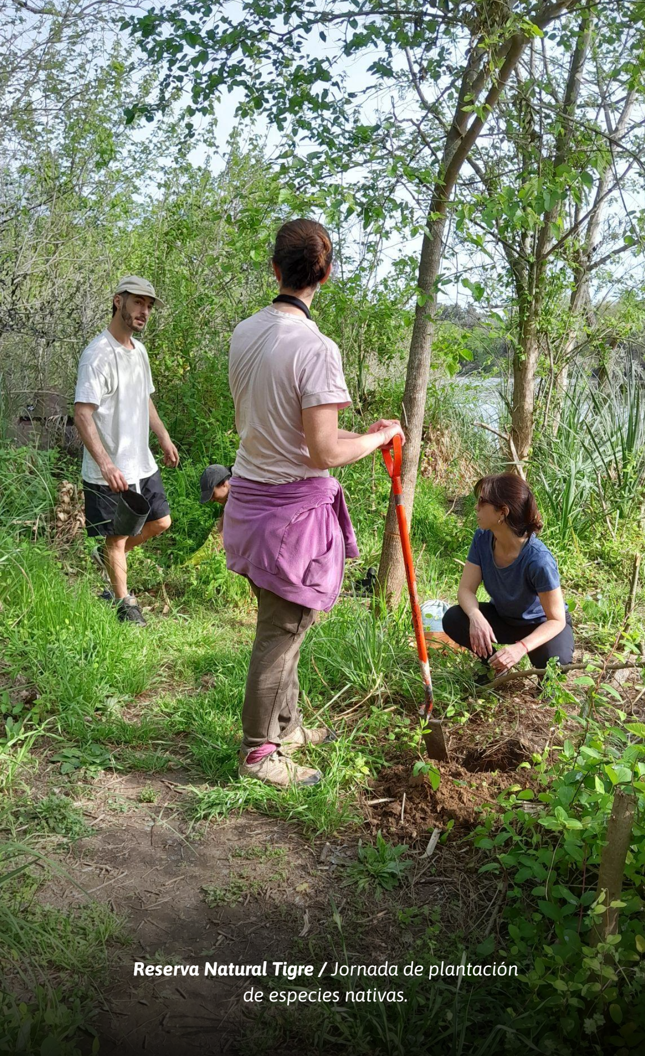
Reserva Natural Tigre / Jornada de plantación de especies nativas.