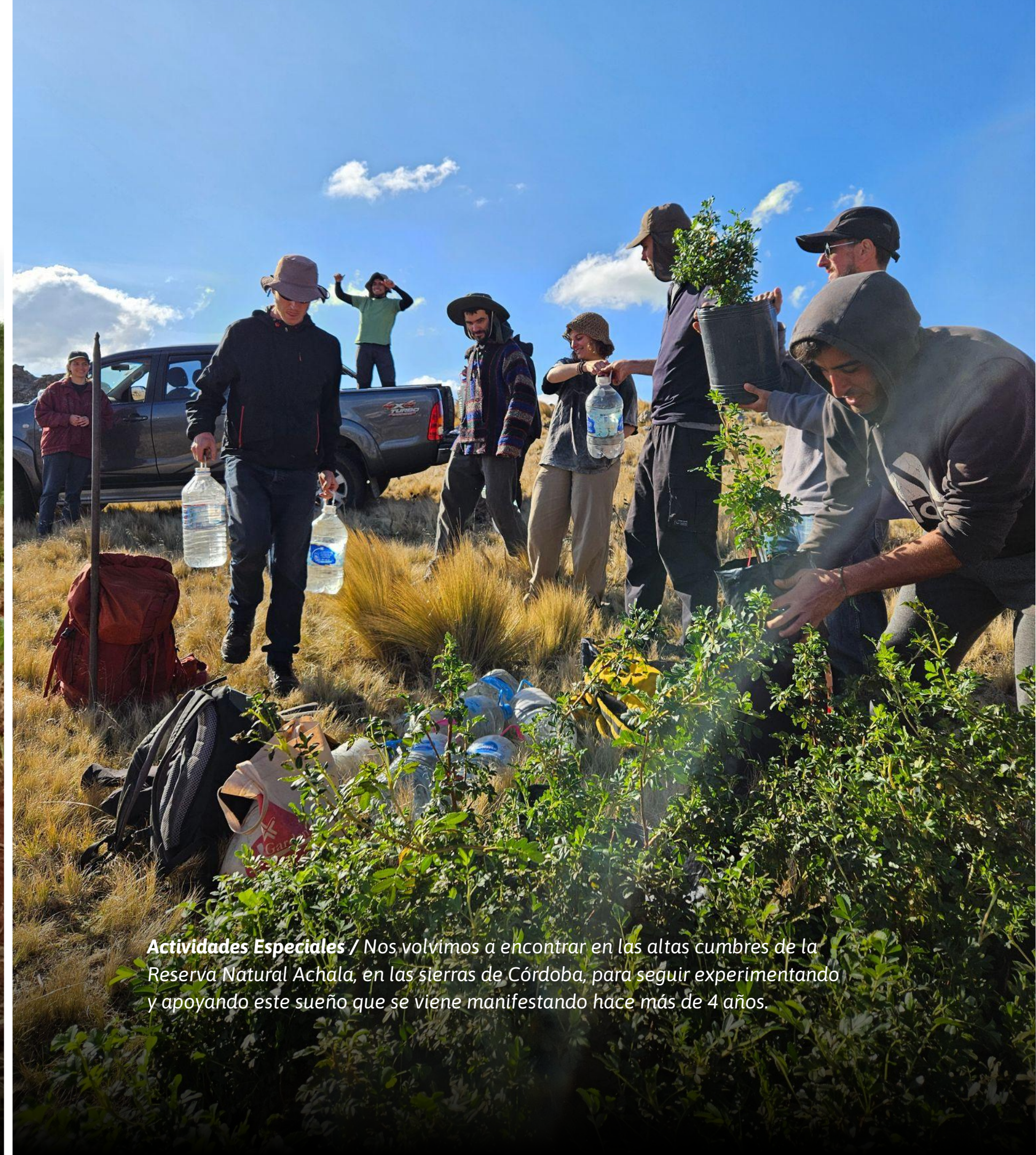
Actividades Especiales / Nos volvimos a encontrar en las altas cumbres de la Reserva Natural Achala, en las sierras de Córdoba, para seguir experimentando y apoyando este sueño que se viene manifestando hace más de 4 años.