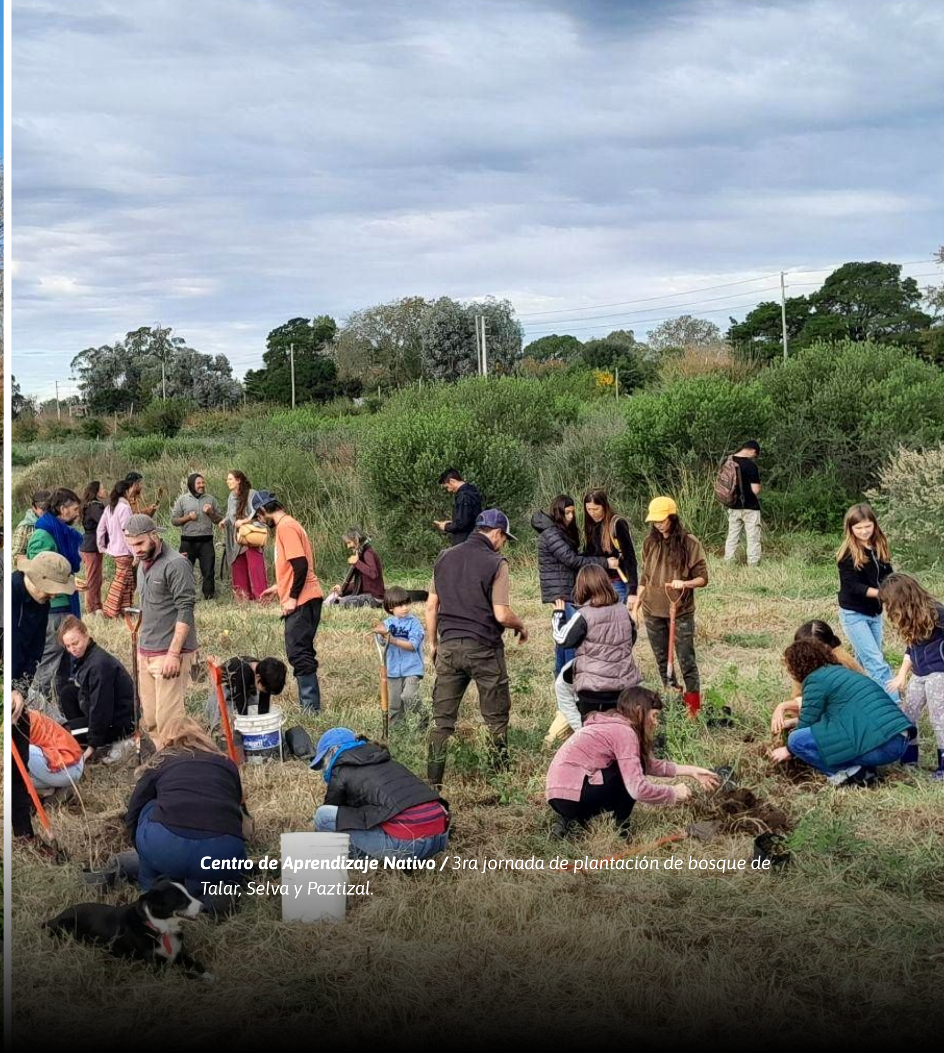
Centro de Aprendizaje Nativo / 3ra jornada de plantación de bosque de Talar, Selva y Paztital.