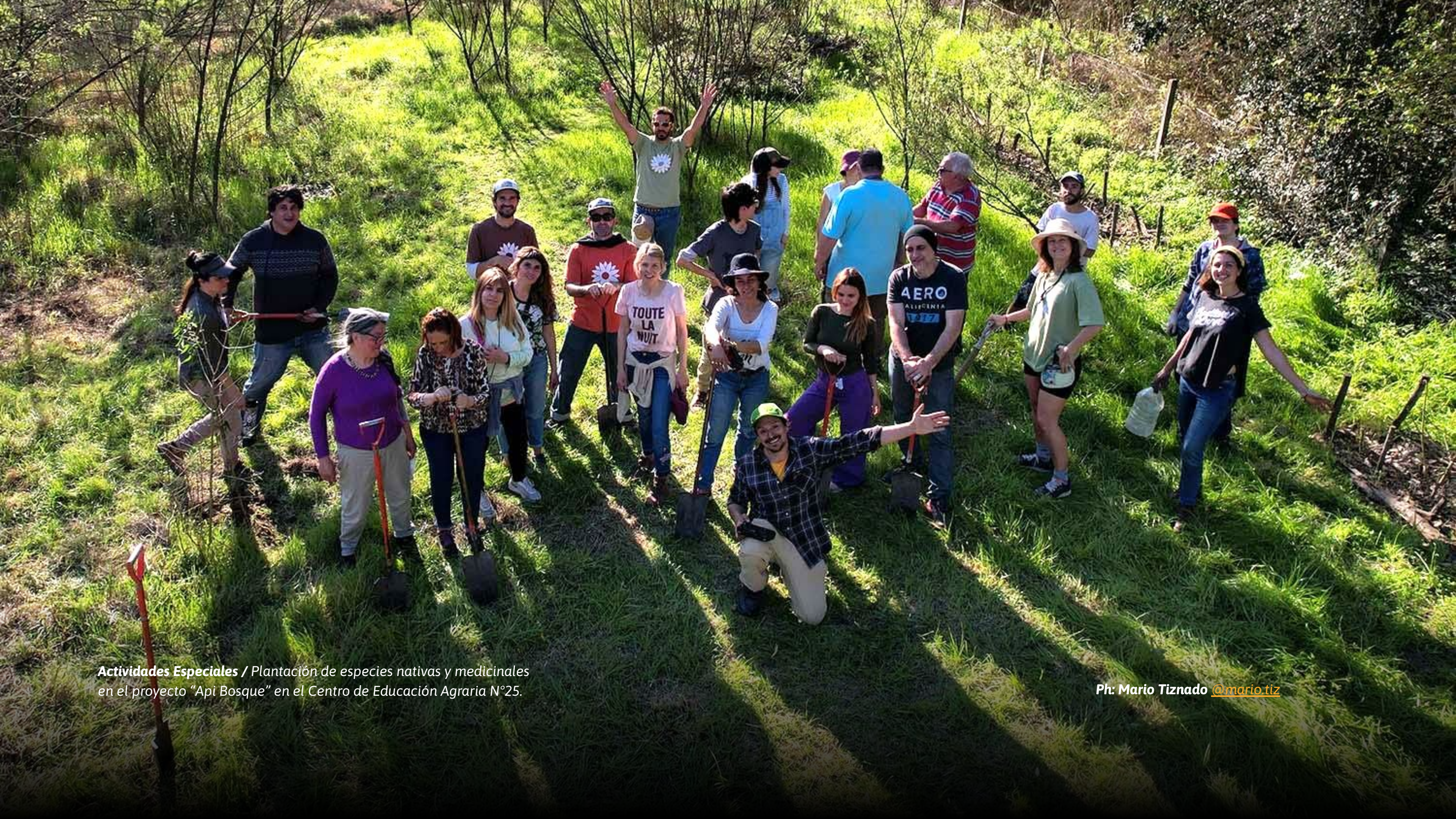
Actividades Especiales / Plantación de especies nativas y medicinales en el proyecto "Api Bosque" en el Centro de Educación Agraria N°25.