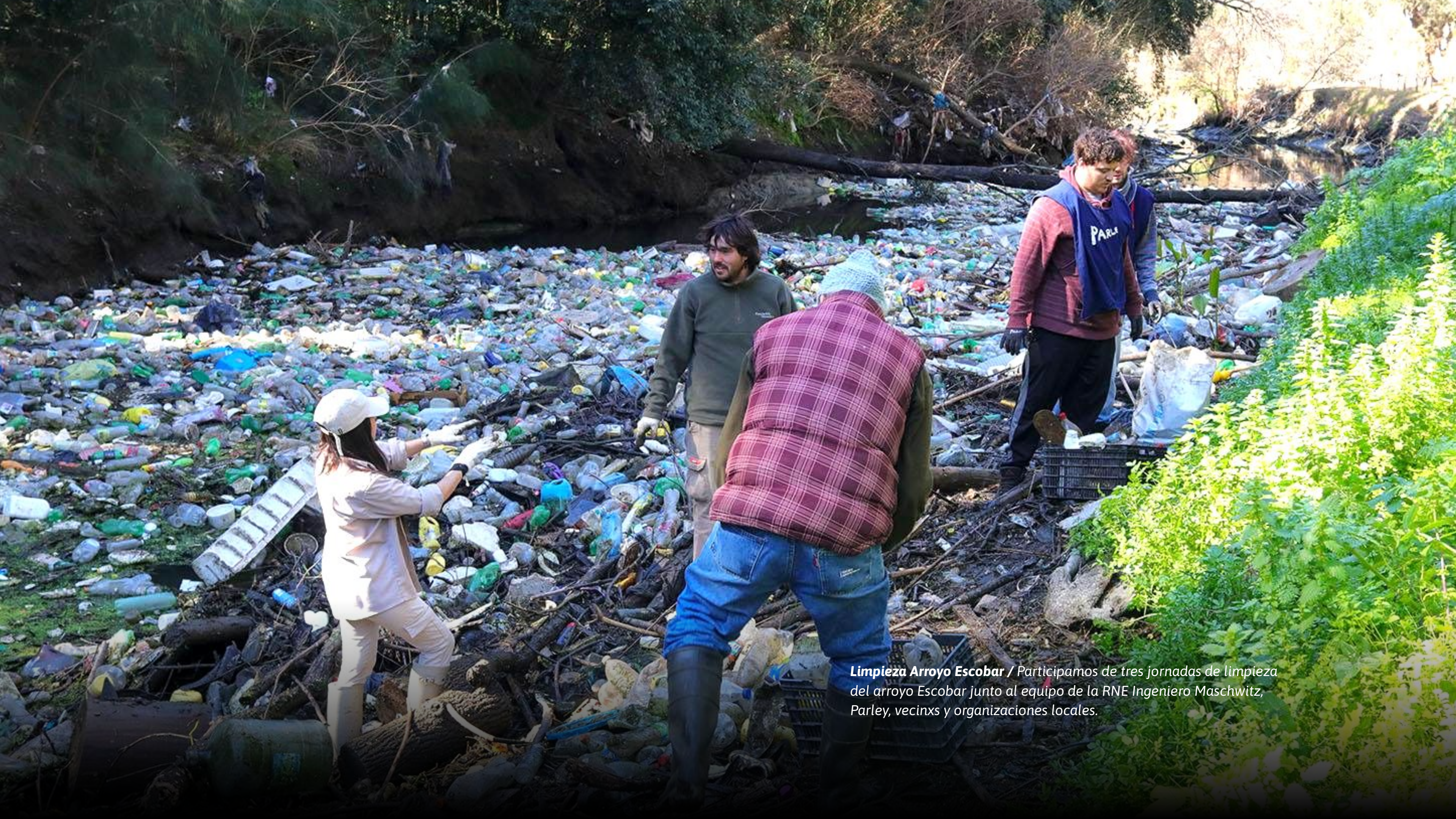
Limpieza Arroyo Escobar / Participamos de tres jornadas de limpieza del arroyo Escobar junto al equipo de la RNE Ingeniero Maschwitz, Parley, vecinxs y organizaciones locales.