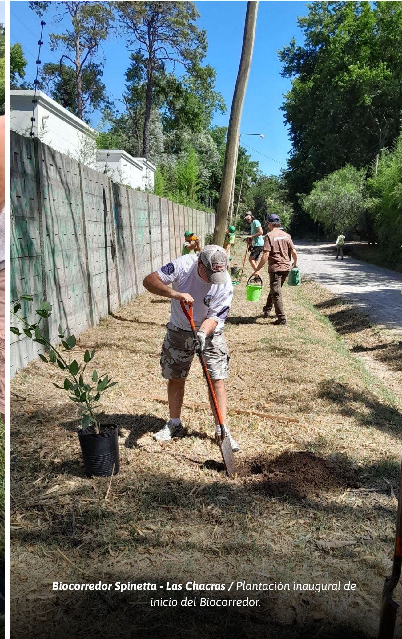
Biocorredor Spinetta - Las Chacras / Plantación inaugural de inicio del Biocorredor.